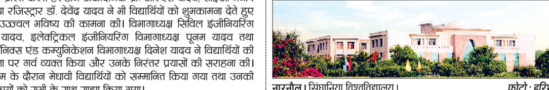
नारनौल। सिंधानिया विश्वविद्यालय।

नारनौल। पेशेरी बड़ी स्थित सिंधानिया विश्वविद्यालय ने उच्च शिक्षा के क्षेत्र में एक महत्वपूर्ण कदम उठाते हुए सीयूडटी यूजी 2026 में स्वयं को शामिल कर लिया है। इसके साथ ही विश्वविद्यालय की प्रवेश प्रक्रिया को राष्ट्रीय स्तर का एक मजबूत मंच प्रदान हुआ है। विश्वविद्यालय के विभिन्न स्नातक कार्यक्रम में प्रवेश अब सीयूडटी के माध्यम से भी किया जा सकता है। सीयूडटी जिसे नेशनल टेरिटरिग एजेंसी द्वारा आयोजित किया जाता है, देशभर के विभिन्न विश्वविद्यालयों में प्रवेश के लिए एक साझा और पारदर्शी प्रणाली प्रदान करता है। इस परीक्षा के माध्यम से छात्र एक ही स्कोर के आधार पर कई विश्वविद्यालयों में आवेदन कर सकते हैं, जिससे उन्हें अलग-अलग प्रवेश परीक्षाओं से राहत मिलती है। सिंधानिया विश्वविद्यालय द्वारा सीयूडटी के अंतर्गत बीएससी व बीटेक सहित विभिन्न स्नातक कार्यक्रम में प्रवेश प्रदान किया जाएगा। इसके लिए संबंधित विषय संयोजन एवं पात्रता मानदंड निर्धारित किए गए हैं, जिससे विद्यार्थियों को अपने रुचि एवं योग्यता के अनुरूप पाठ्यक्रम चुनने का अवसर मिलेगा। विश्वविद्यालय प्रशासन का मानना है कि सीयूडटी में शामिल होने से प्रवेश प्रक्रिया अधिक पारदर्शी, मेरिट आधारित एवं प्रतिस्पर्धात्मक बनेगी। साथ ही, ग्रामीण एवं स्थानीय क्षेत्रों के विद्यार्थियों को भी राष्ट्रीय स्तर पर अपनी प्रतिभा प्रदर्शित करने का बेहतर अवसर मिलेगा।