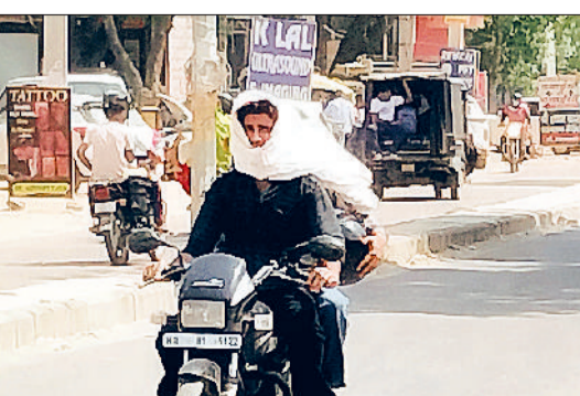
रेवाड़ी। शुक्रवार को लू से बचाव के साथ बावल रोड से गुजरता बाइक चालक।

है। अभी तक रात का तापमान 21 डिग्री सेल्सियस से नीचे ही चल रहा था, जिससे रात के समय गर्मी का असर नहीं बढ़ा था। वीरवार की रात तापमान 4.0 डिग्री सेल्सियस की वृद्धि के साथ 25.0 डिग्री सेल्सियस पर पहुंच गया, जिससे यह रात सीजन की सबसे गर्म रात साबित हुई। बीते वर्ष की तुलना में रात का पापा 7.4 डिग्री सेल्सियस ज्यादा रहा। गत वर्ष 24 अप्रैल को अधिकतम तापमान 41.5 डिग्री और न्यूनतम 17.6 डिग्री सेल्सियस दर्ज किया गया था। शुक्रवार को