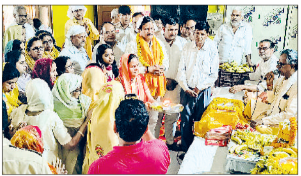
रेवाड़ी। सुंदरकांड पाठ के समापन पर आरती करते हुए।

परीक्षा की शुचिता बनाए रखने के लिए जिले की राजस्व सीमा में संचालित सभी कॉविंग सेंटरों को भी परीक्षा के दिन बंद रखा जाएगा। जिला मजिस्ट्रेट ने स्पष्ट किया है कि परीक्षा केंद्रों पर केवल अधिकृत नागरिकों को ही प्रवेश की अनुमति होगी, जिसके लिए सख्त प्राधिकारी द्वारा जारी पहचान पत्र अनिवार्य है। इन आदेशों के उल्लंघन को गंभीरता से लिया जाएगा और दोषी पाए जाने वाले व्यक्ति के विरुद्ध भारतीय न्याय संहिता की धारा 223 के तहत सख्त कानूनी कार्रवाई अमल में लाई जाएगी। जिलाधीश ने पुलिस प्रशासन को इन निर्देशों का कड़ाई से लागू सुनिश्चित करने के आदेश दिए गए हैं ताकि परीक्षा के दौरान कानून व्यवस्था सुचारू बनी रहे।