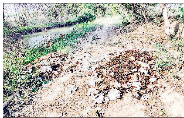
मंडी अटेली। सिहमा नहर किनारे पड़ी मरी हुई मुर्गियां।

सिहमा गांव के पास नारनौल ब्रांच नहर की पाइपलाइन पर अज्ञात लोगों द्वारा सैकड़ों की संख्या में मरी हुई मुर्गियां फेंकने का मामला सामने आया है। यह मुर्गियां खामपुरा की ओर जाने वाले रास्ते पर बीती रात्रि के डाली गईं, जिससे पूरे क्षेत्र में तीव्र दुर्गंध फैल गई है और ग्रामीणों में भारी आक्रोश बना हुआ है। ग्रामीणों के अनुसार यह पाइपलाइन खेतों में जाने का मुख्य मांग है जहां से किसान, मजदूर और अन्य लोग रोजाना गुजरते हैं। सुबह जब लोग खेतों की ओर गए तो रास्ते पर बड़ी संख्या में मरी हुई मुर्गियां