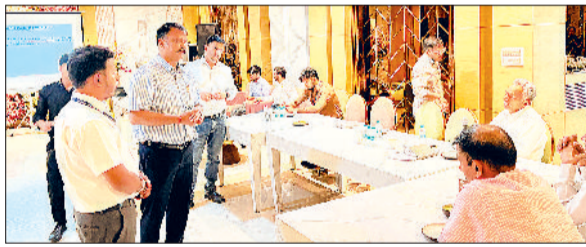
रेवाड़ी। जिमखाना क्लब में जानकारी देते आईजीएल के अधिकारी।