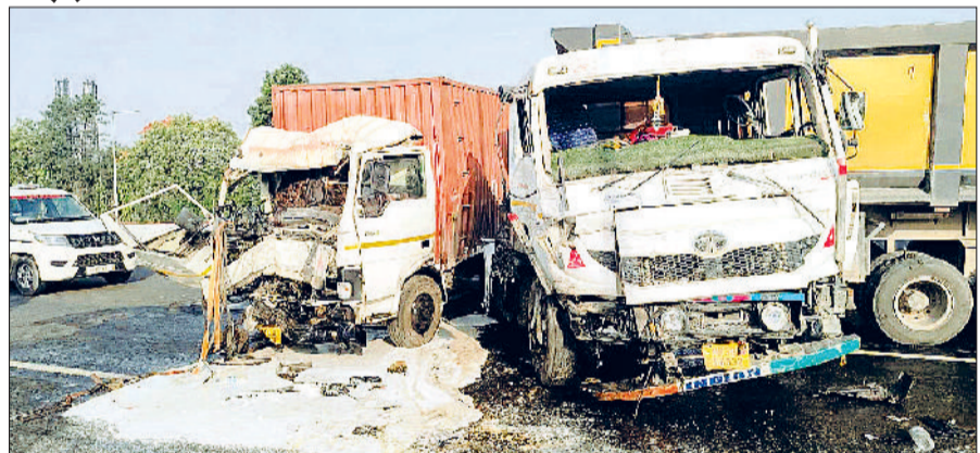
रेवाड़ी। हाइवे पर क्षतिग्रस्त कैंटर व ट्रक।

हरिभूमि न्यूज रेवाड़ी दिल्ली-जयपुर नेशनल हाइवे पर शुक्रवार सुबह जयपुर से दिल्ली की ओर जा रहा एक ट्रक आसलवास के पास अनियंत्रित होने के बाद डिवाइडर कुदकर हाइवे की दूसरी साइड में चला गया। ट्रक दिल्ली की ओर से आ रही कैंटर को टक्कर मारने के बाद एक अन्य वाहन से भी टकराया गया। कैंटर चालक हादसे में गंभीर रूप से घायल हो गया। लगभग एक घंटे तक हाइवे पर जाम लगा रहा। बाद में पुलिस ने दुर्घटनाग्रस्त वाहनों से हटवाकर यातायात सुचारू कराया। चालक