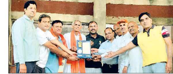
रेवाड़ी। राजकीय पॉलिटेक्निक में योग शिविर के समापन पर सम्मानित करते हुए।

राजकीय पॉलिटेक्निक लिसाना में तीन दिवसीय योग शिविर का समापन हरिभूमि न्यूज ▶▶ रेवाड़ी