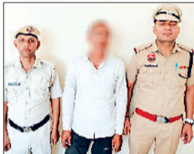
रेवाड़ी। पुलिस गिरफ्त में आरोपी।

गए। कैंटर में फंसे चालक को बाहर निकालकर अस्पताल पहुंचाया गया। सूचना मिलने के बाद पुलिस भी मौके पर पहुंच गई। हाइवे पर तीन वाहन दुर्घटनाग्रस्त होने से दिल्ली से जयपुर की ओर जाने वाले लेन पर यातायात बाधित हो गया। वाहनों की लंबी लाइनें लग गईं। पुलिस ने क्रेन की मदद से वाहनों को हाइवे से हटवाकर यातायात सुचारू कराया। लगभग एक घंटे तक वाहन चालकों को परेशानी का सामना करना पड़ा। पुलिस ने केस दर्ज करने के बाद ट्रक चालक का पता लगाने के प्रयास शुरू कर दिए हैं।