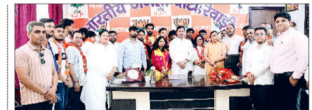
रेवाड़ी। कार्यक्रम में मौजूद खेल मंत्री व अन्य पदाधिकारी।